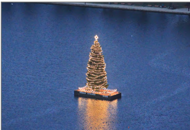
„Alstertanne“ Motiv: 1077 0