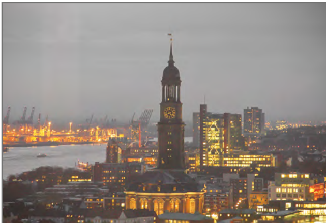
„Michel“ Motiv: 1076 7