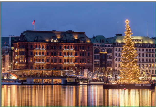
„Alstertanne“ Motiv: 1074 1