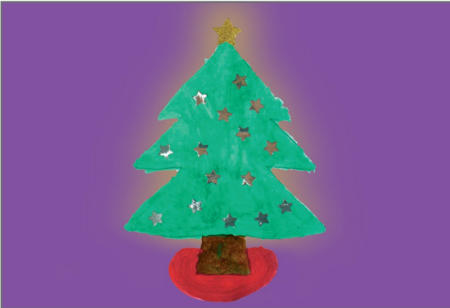
„Weihnachtsbaum“ Bild von Cheyenne, 8 Jahre Motiv: 1072 5

KNACK DEN KREBS Fördergemeinschaft Kinderkrebs-Zentrum Hamburg e.V.