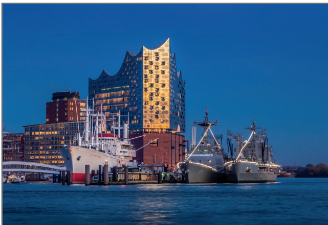
„Elbphilharmonie“ Motiv: 1070 9