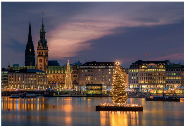
„Alstertanne“ Motiv: 1069 1